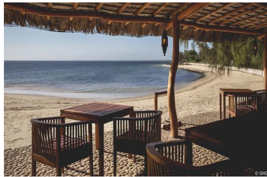
Hotel Les Dunes – Индийски океан