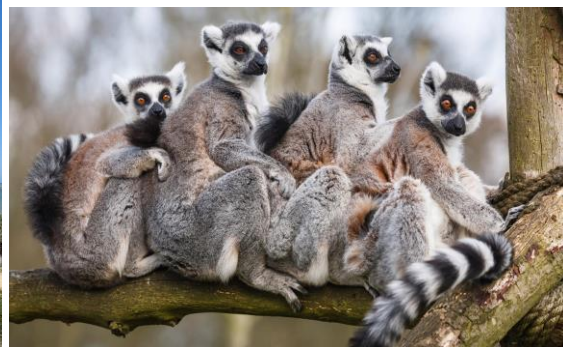
Лемури в парка Анджа

Остров Мадагаскар е девствено място, пълно с обещания, място, където слънцето е щедро, бреговете – великолепни, а океанът - благосклонен. Определено той предлага несравними преживявания заради необикновената си и разнообразна природа, а тя е ярка, богата на цветове и живот. Фауната му е наистина уникална – хамелеони, гекони, птици, гигантски пеперуди, но все пак най-известен представител остава лемурът – всички 75 вида от тези пухкави създания са изцяло ендемични. Не по-малко вълнуваща е и флората на острова. Освен като най-големия производител и износител на ванилия в света, Мадагаскар е познат и с добива на растителния екстракт от цветовете на тропическото дърво иланг-иланг („цвете на цветята“). Особено поразително за чужденците е и дървото на пътешественика, в чиито листа се събира течност, с която пътникът може да утоли жаждата си. Огромни и елегантни, сякаш стоят на пост, на сред равния и пуст пейзаж се извисяват стволите на баобаб - националното дърво на Мадагаскар. Заради огромните си размери, възрастта, до която достига, и стъблото си, в което може да се открие и складира вода, баобабът заема централно място в културата на Мадагаскар. Шарената смесица от традиции и бит се е запазила през годините.