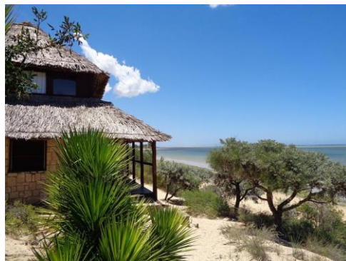
Hotel Le Paradisier – Индийски океан