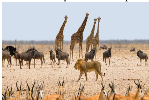
Национален парк Етоша