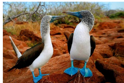
Галапагос – синьокрак рибояд

Колумбия в съзнанието на повечето хора има интересна слава. Първата асоциация на повечето хора е кафе, наркокартели, сериали и красавици. В действителност обаче далечната държава е гостоприемна страна, в която ще намерите много красота, слънце и цветове. Като всяка държава от Латинска Америка, Колумбия предлага чувствени изкушения, но има още тайни за споделяне. След десетилетия наред на гражданска война, днес Колумбия тръпне в очакване светът отново да я преоткрие. Дълго време носеща имиджа на страна с висока престъпност и засилен наркотрафик, днес латиноамериканската държава се превръща във все по-безопасна и атрактивна туристическа дестинация. Разнообразието на Колумбия е наистина невероятно – погледът се рее над гъсти тропически джунгли, обширни кафеени плантации и екзотични карибски плажове. Уникалният микс от красиви колониални градове, контрастиращи на модерните градове с блестящи и издължени небостъргачи е наистина впечатляващ. Пътуването до Колумбия ще остави у вас щастливото усещане от дързостта, че сте посетили място, толкова уникално и несравнимо, използвано със своята загадъчност и екзотика в толкова филмови сюжети, че самите вие ще се почувствате като герои във ваша собствена приказка.