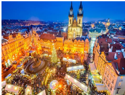
Прага – Старе место

5 дни/ 4 нощувки/ 4 закуски Дати: 16 – 20 декември 2022 г.