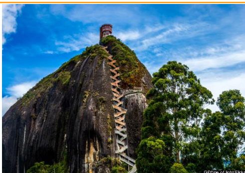
Гуатапе – скалата Пенюл