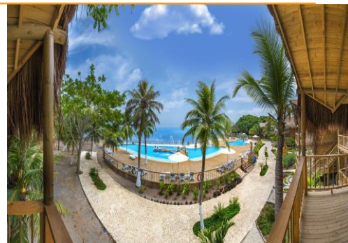
о-в Бару – хотел Isla del Encanto

Колумбия в съзнанието на повечето хора има интересна слава. Първата асоциация на повечето хора е кафе, наркокартели, сериали и красавици. В действителност обаче далечната държава е гостоприемна страна, в която ще намерите много красота, слънце и цветове. Като всяка държава от Латинска Америка, Колумбия предлага чувствени изкушения, но има още тайни за споделяне. След десетилетия наред на гражданска война, днес Колумбия тръпне в очакване светът отново да я преоткрие. Дълго време носеща имиджа на страна с висока престъпност и засилен наркотрафик, днес латиноамериканската държава се превръща във все по-безопасна и атрактивна туристическа дестинация. Разнообразието на Колумбия е наистина невероятно – погледът се рее над гъсти тропически джунгли, обширни кафеени плантации и екзотични карибски плажове. Уникалният микс от красиви колониални градове, контрастиращи на модерните градове с блестящи и издължени небостъргачи е наистина впечатляващ. Пътуването до Колумбия ще остави у вас щастливото усещане от дързостта, че сте посетили място, толкова уникално и несравнимо, използвано със своята загадъчност и екзотика в толкова филмови сюжети, че самите вие ще се почувствате като герои във ваша собствена приказка.