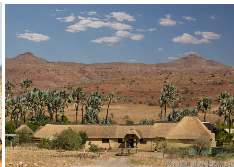
Национален резерват Палмваг