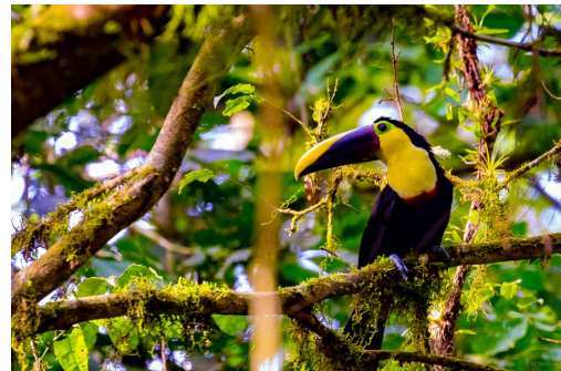
Биорезерват Ла Селва