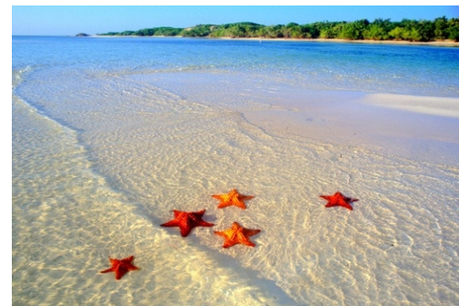
Плажа на морските звезди – Бокас дел Торо

Коста Рика е Pura Vida, което буквално означава „чист живот“ и е нещо като национална житейска философия за хубав, пълноценен и щастлив живот. Не случайно „тикосите“, както сами се наричат местните са едни от най-щастливите хора на планетата, а страната им е известна с прозвището „Швейцария на Централна и Южна Америка“. Чистият живот е доведен почти до крайности. Опазването на околната среда е като религия.