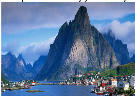
Рейне (островите Лофотен)