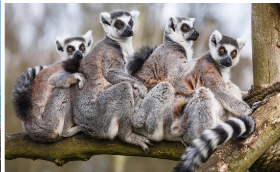
Лемури в парка Анджа

Остров Мадагаскар е девствено място, пълно с обещания, място, където слънцето е щедро, бреговете – великолепни, а океанът - благосклонен. Определено той предлага несравними преживявания заради необикновената си и разнообразна природа, а тя е ярка, богата на цветове и живот. Фауната му е наистина уникална – хамелеони, гекони, птици, гигантски пеперуди, но все пак най-известен представител остава лемурът – всички 75 вида от тези пухкави създания са изцяло ендемични. Не по-малко вълнуваща е и флората на острова. Освен като най-големия производител и износител на ванилия в света, Мадагаскар е познат и с добива на растителния екстракт от цветовете на тропическото дърво иланг-иланг („цвете на цветята“). Особено поразително за чужденците е и дървото на пътешественика, в чиито листа се събира течност, с която пътникът може да утоли жаждата си. Огромни и елегантни, сякаш стоят на пост, наред равния и пуст пейзаж се извисяват стволовете на баобаба - националното дърво на Мадагаскар. Заради огромните си размери, възрастта, до която достига, и стъблото си, в което може да се открие и складира вода, баобабът заема централно място в културата на Мадагаскар. Шарената смесица от традиции и бит се е запазила през годините.