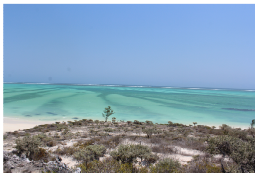
Ankasy Lodge – Индийски океан