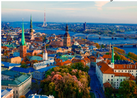
Рига – поглед към града