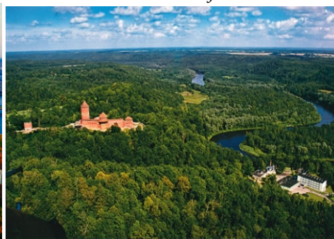
Замъка Турайда в Национален парк Гауя